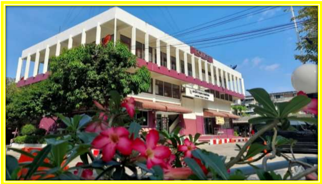
สถานีตำรวจนครบาลหลักสอง