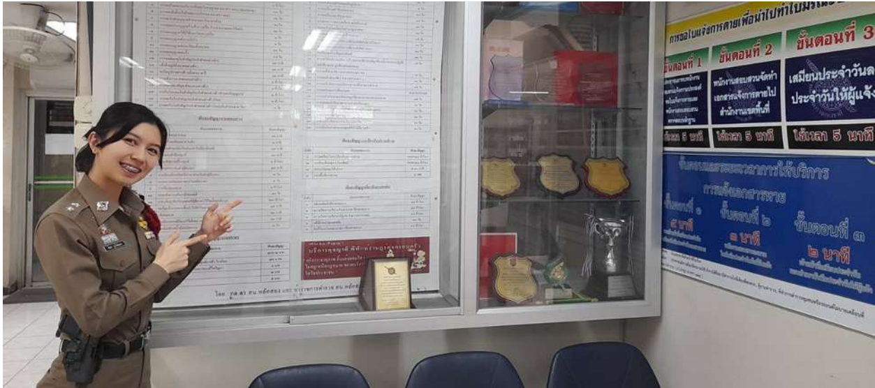
ภาพ ป้ายพันธสัญญา ที่ติดประกาศบริเวณ ชั้น ๑

๕) แผ่นป้ายประกาศให้ดำเนินการจัดทำ โดยใช้สีและขนาดตามความเหมาะสมของพื้นที่ ที่จะติดประกาศในแต่ละสถานีตำรวจ