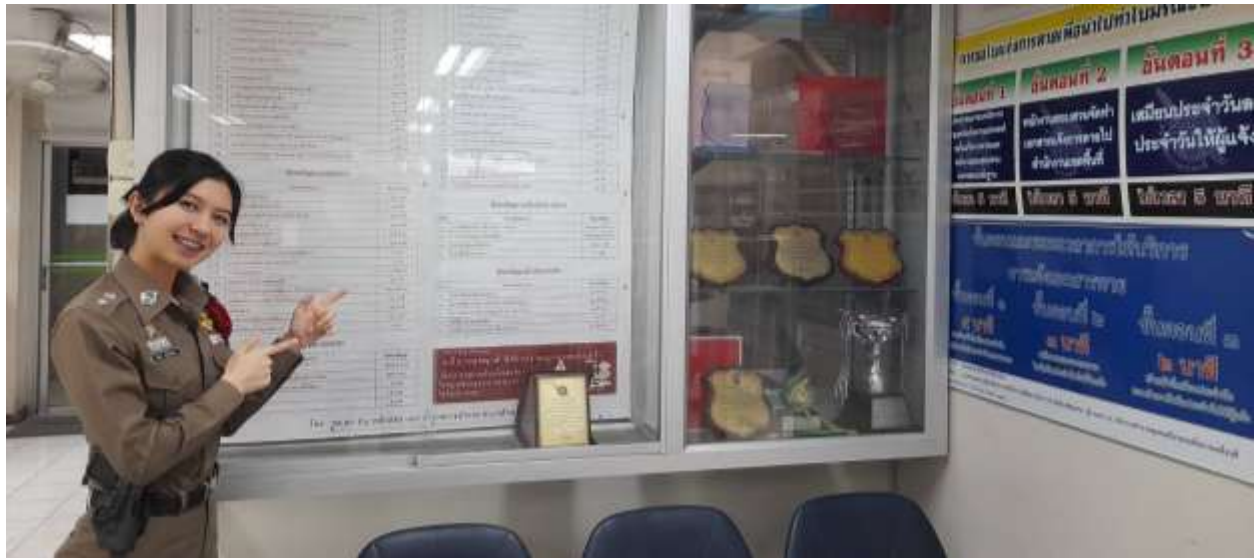
ภาพ ป้ายพันธสัญญาการให้บริการ