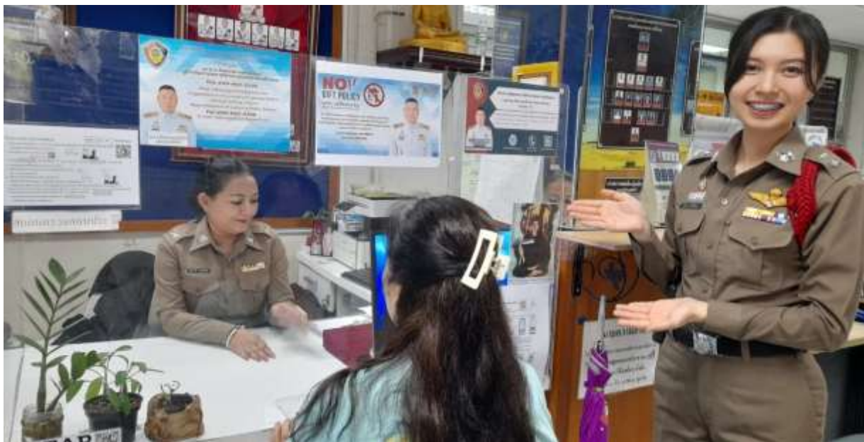
ภาพ ประชาชนมารับบริการแจ้งเอกสารหาย