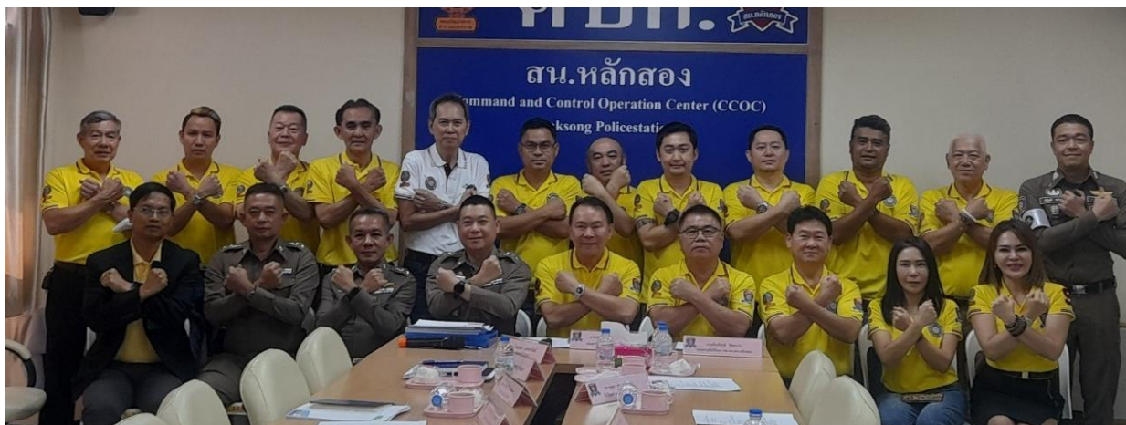
ภาพ ร่วมกับ กต.ตร.สน.หลักสอง ประกาศไม่ให้ ไม่รับ