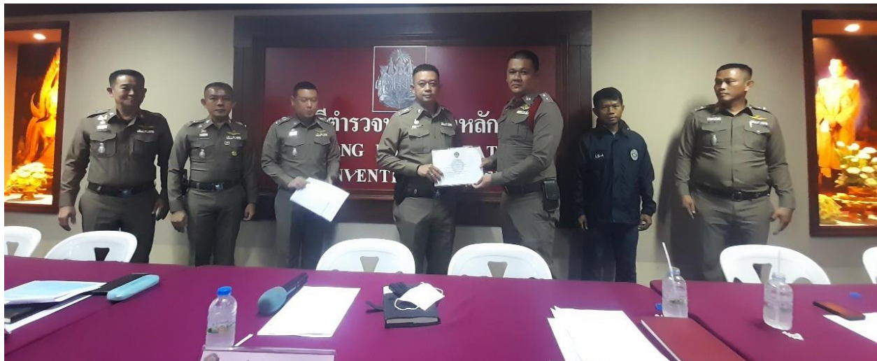
ภาพ การมอบประกาศให้เจ้าหน้าที่ฝ่ายสอบสวน