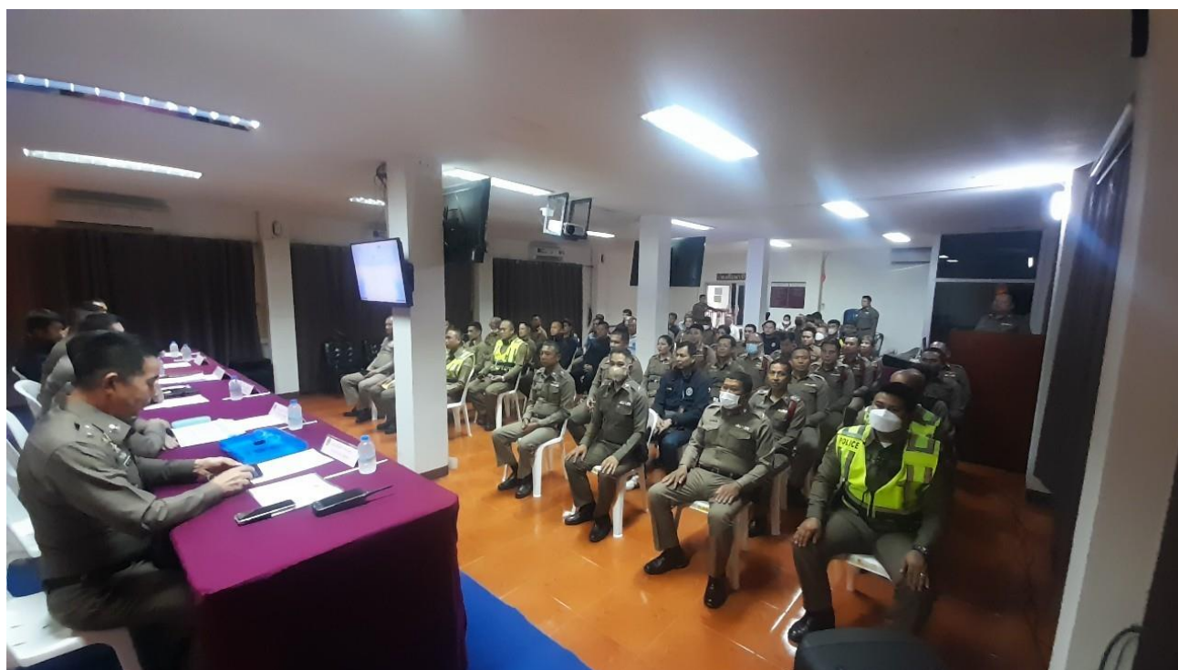
ภาพ มีการชี้แจงการใช้จ่ายเงินกองทุน ผ่านการประชุมประจำเดือน

ผลดำเนินการ ไม่พบข้าราชการตำรวจถูกร้องเรียน หรือกระทำผิด