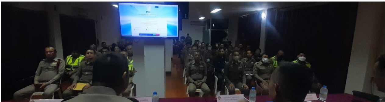
ภาพ การประชุมชี้แจงการประเมิน ให้กับข้าราชการตำรวจ