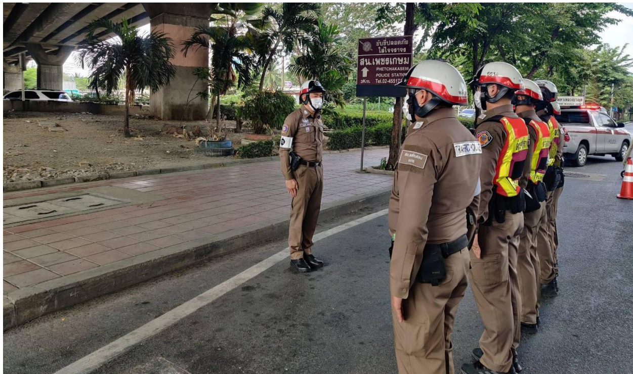
ภาพ การตั้งจุดตรวจมีนายตำรวจระดับ สารวัตรควบคุมการปฏิบัติ