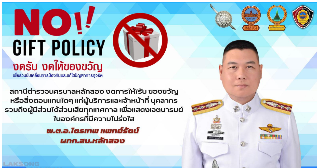
ภาพ ประกาศไม่ให้ ไม่รับ

ผู้บริหารและบุคลากรของสถานีตำรวจนครบาลหลักสองไม่มีเรื่องร้องเรียนเรื่องสินบน