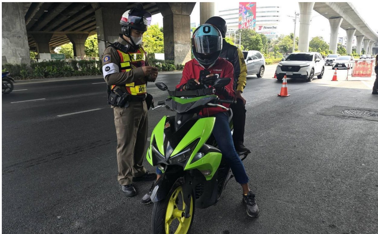
ภาพ เจ้าที่ทุกนายที่ตรวจค้นมีการติดตั้งกล่องบอดี้แคม