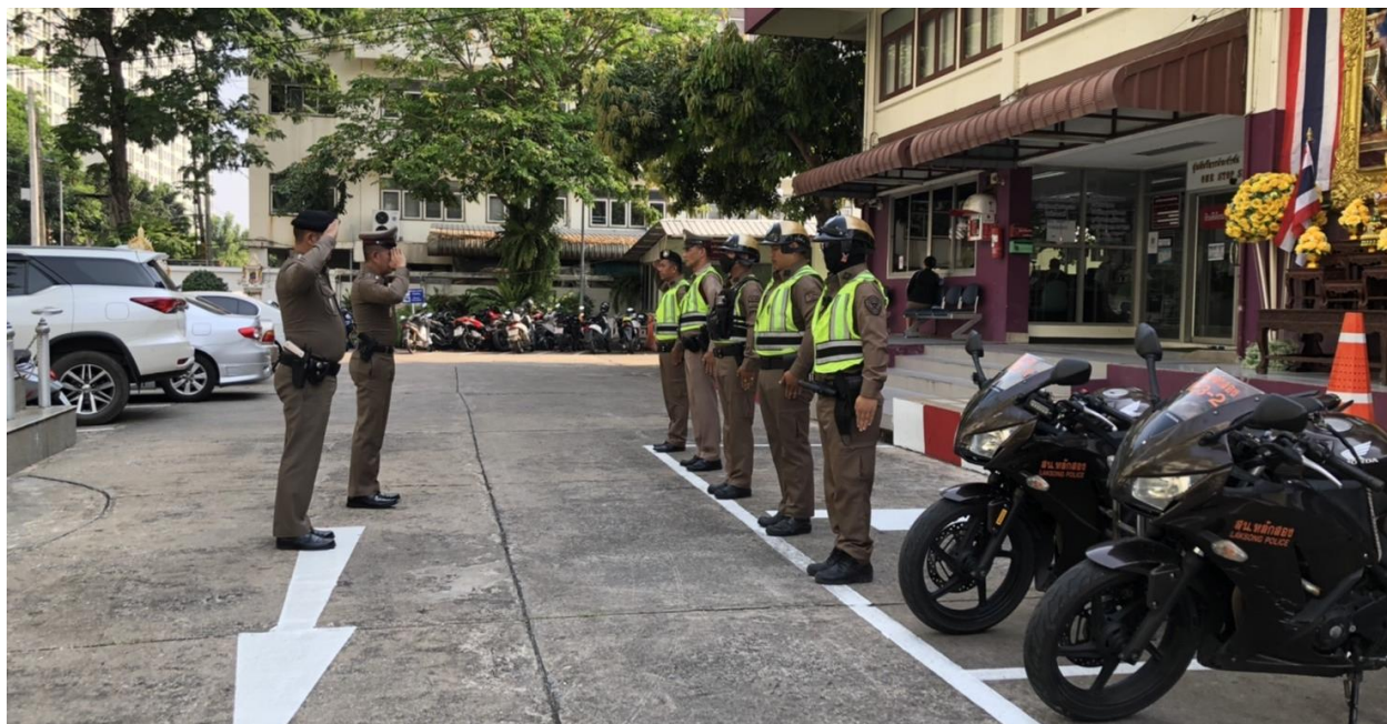
ภาพ ก่อนออกปฏิบัติหน้าสายตรวจทุกผลัดจะมีการอบรมปล่อยแถว