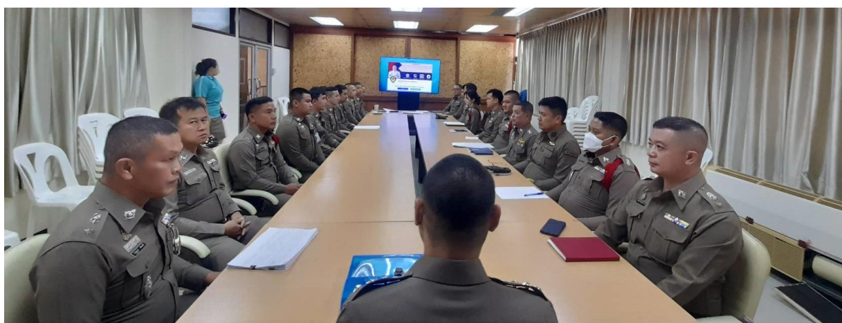
ภาพ การประชุมคณะกรรมการ