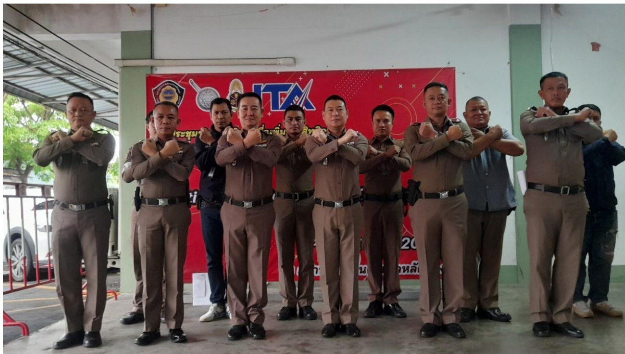
ภาพ กิจกรรมร่วมกันประกาศต่อต้านการทุจริต