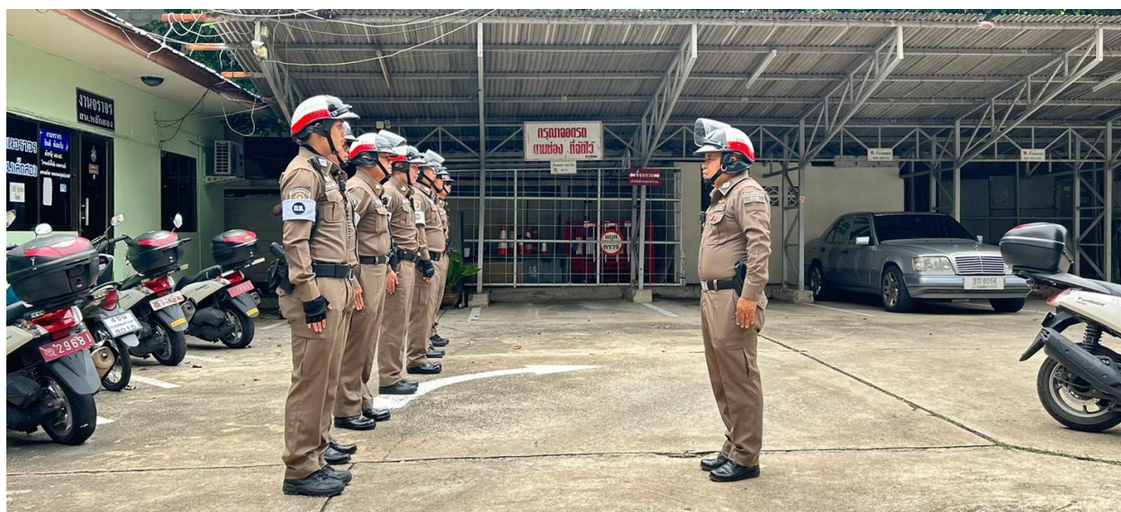
ภาพ ก่อนออกปฏิบัติหน้าที่มีการอบรมให้ความรู้ด้านกฎหมาย กำชับการปฏิบัติ

ผลดำเนินการ ไม่พบข้าราชการตำรวจถูกร้องเรียน หรือกระทำผิด