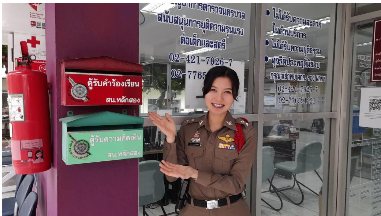
ภาพ ตู้รับเรื่องร้องเรียน

๑. ก่อรับข้อคิดเห็น/ข้อร้องเรียน ณ ชั้น ๑ สถานีตำรวจนครบาลหลักสอง