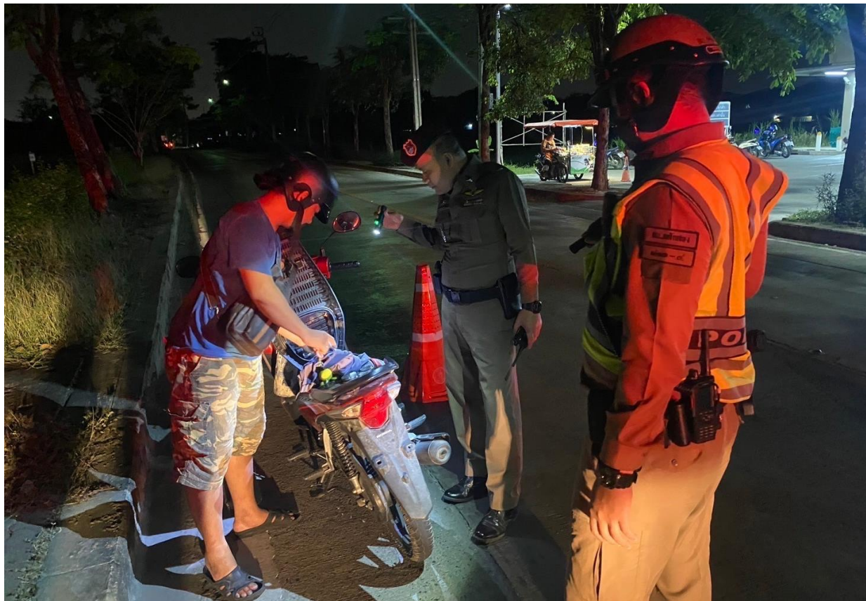
ภาพ เจ้าหน้าที่ที่ตรวจค้นมีกล้องบอดี้แคม