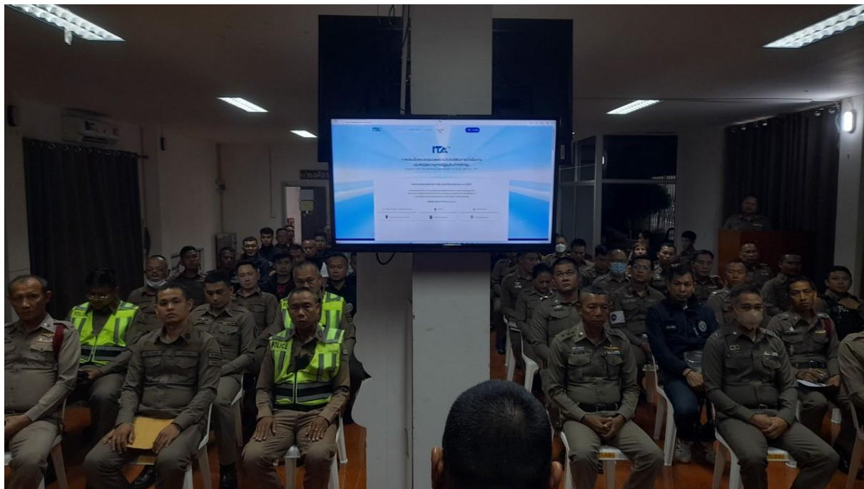
ภาพ การประชุมเจ้าหน้าที่ทุกสายงาน

ผลดำเนินการ ไม่พบข้าราชการตำรวจถูกร้องเรียน หรือกระทำผิด