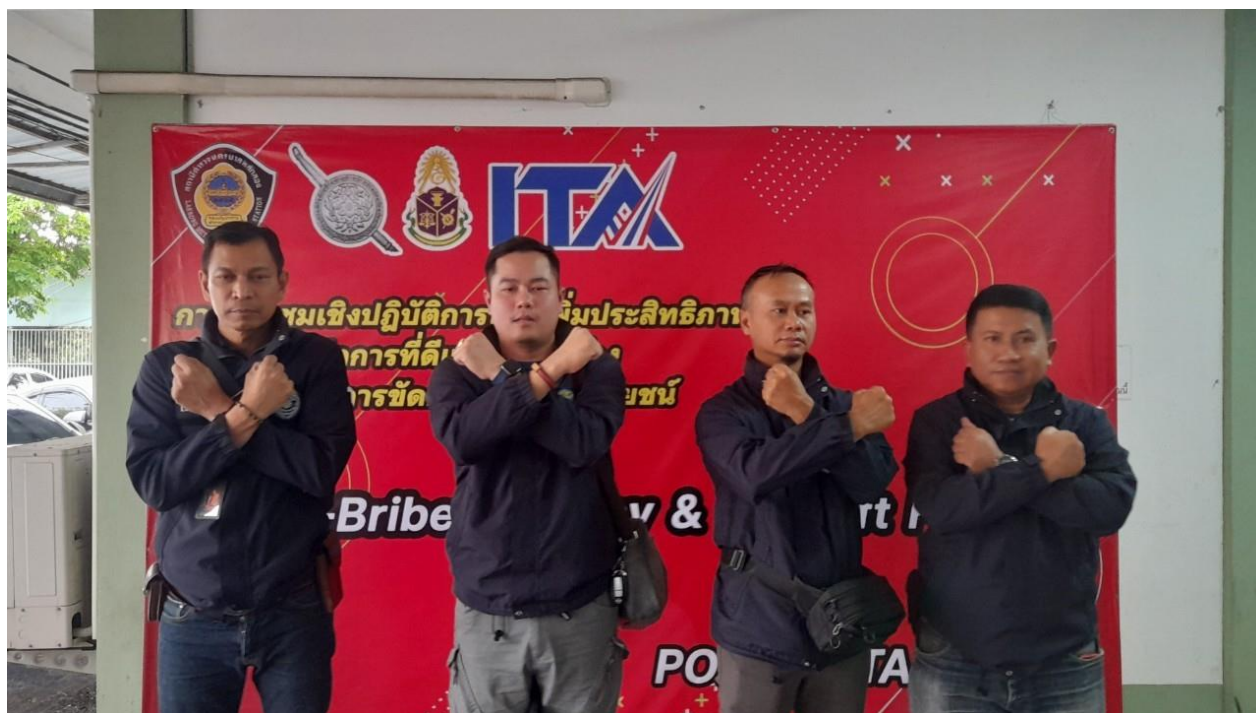
ภาพ การประชุมเจ้าหน้าที่ และเจ้าหน้าที่ฝ่ายสืบสวน ประกาศต่อต้านการทุจริต