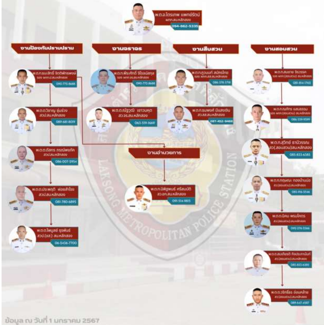
ภาพ ข้อมูลผู้บริหาร สถานีตำรวจนครบาลหลักสอง ปี ๒๕๖๗