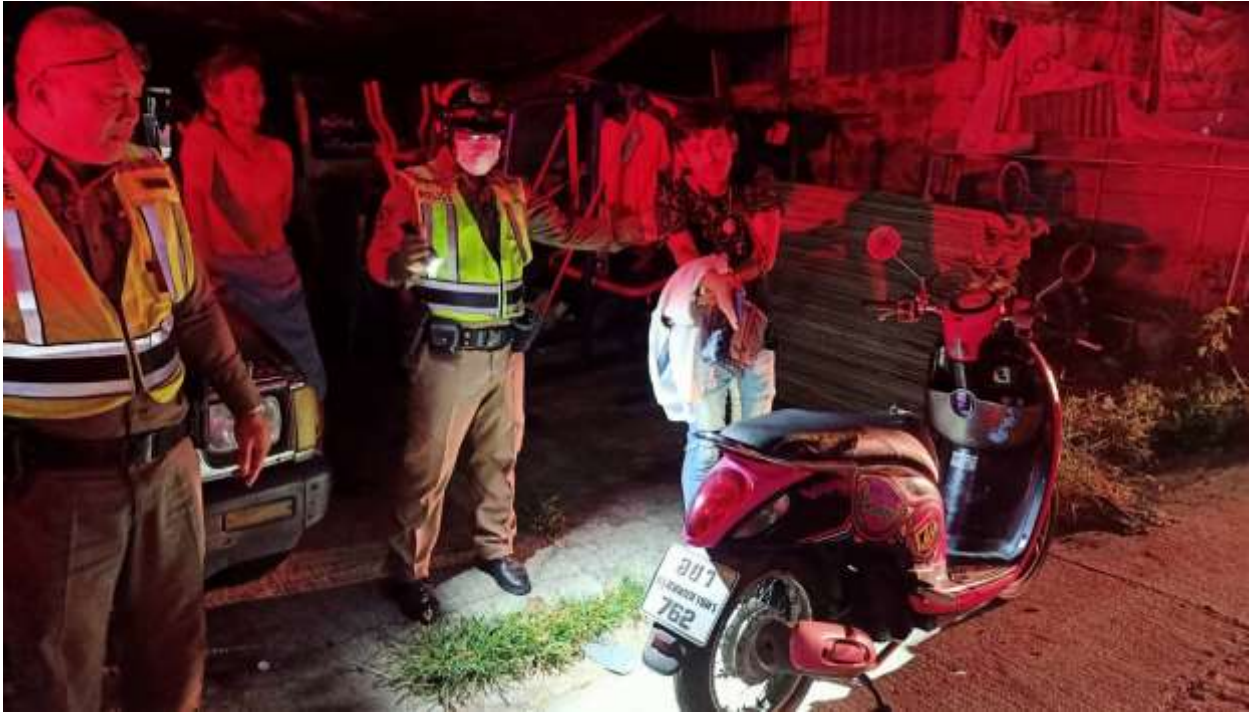
ภาพ การออกตรวจพื้นที่ และจับกุมผู้กระทำความผิด ของงานป้องกันปราบปราม