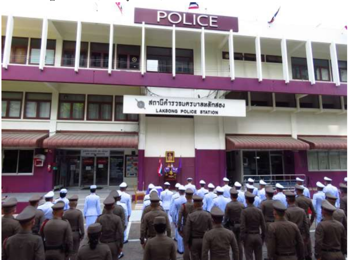
ภาพ สถานีตำรวจนครบาลหลักสอง