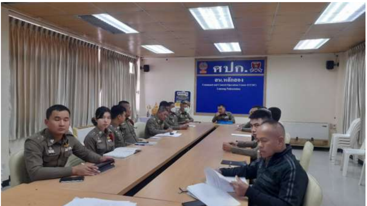
ภาพ การประชุมและอบรมด้านกฎหมาย แก่พนักงานสอบสวน โดย ผกก.สน.หลักสอง