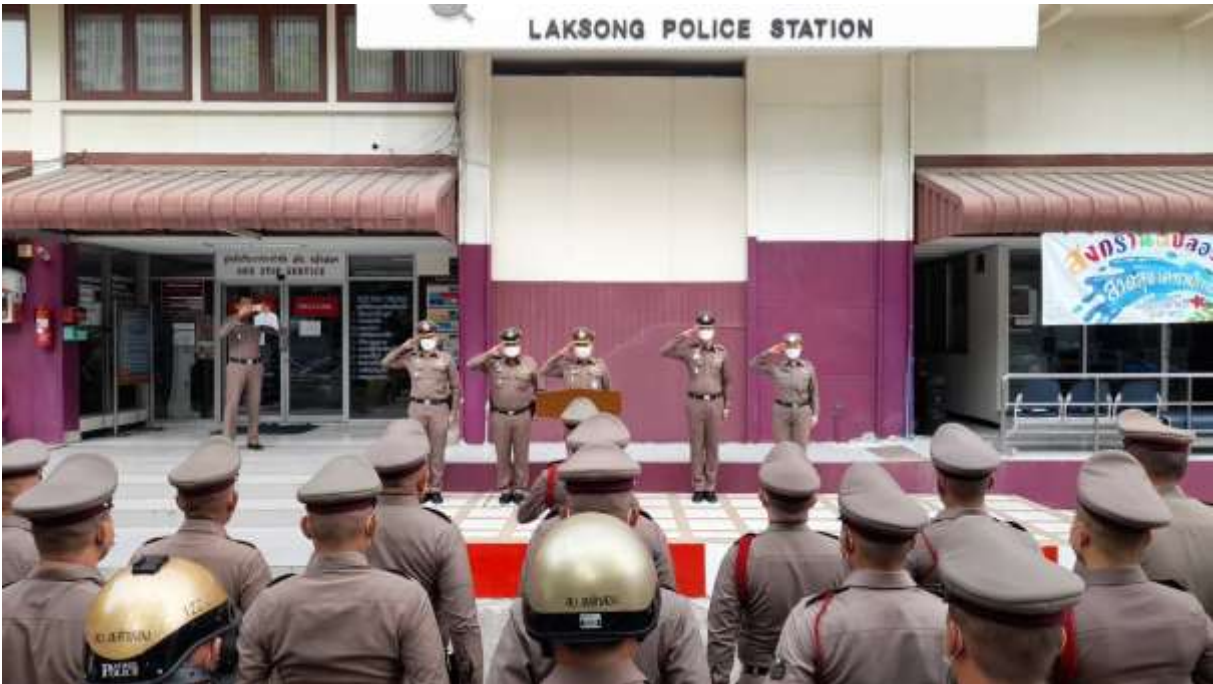
ภาพ การมาตรวจเยี่ยมของผู้บังคับบัญชา