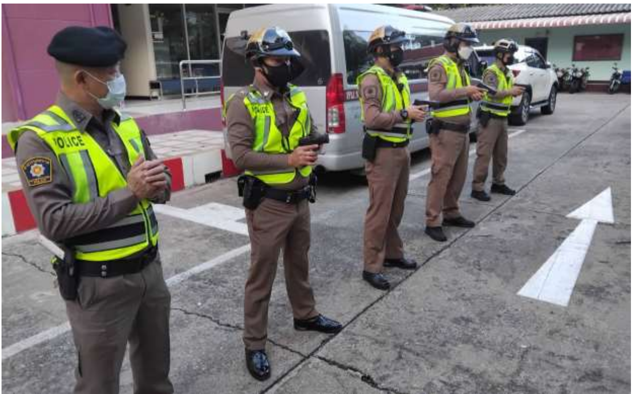
ภาพ การเตรียมความพร้อม ก่อนออกปฏิบัติหน้าที่