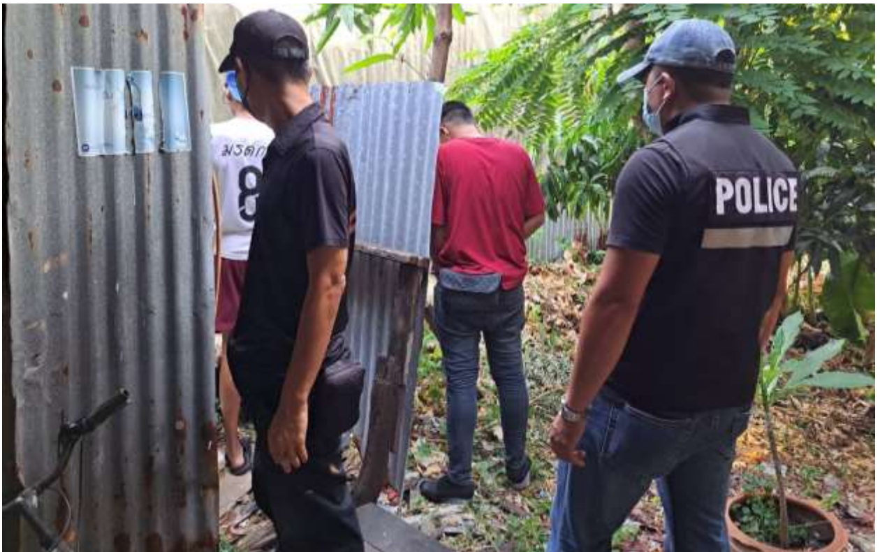
ภาพ งานสืบสวนออกปฏิบัติหน้าที่ในการตรวจสอบสารเสพติดเบื้องต้น

๒๐. ปฏิบัติงานอื่น ๆ ตามที่ผู้บังคับบัญชามอบหมาย