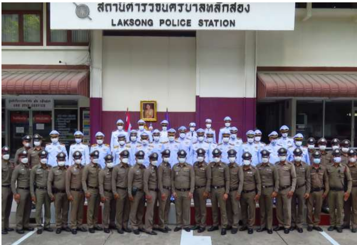
ภาพ ข้าราชการตำรวจสถานีตำรวจนครบาลหลักสอง