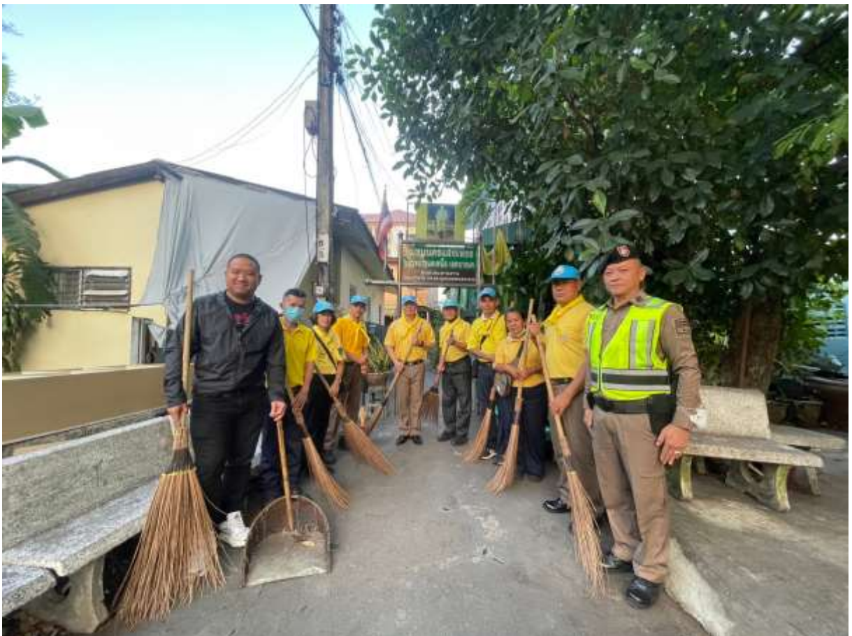
ภาพ เจ้าหน้าที่ตำรวจ สน.หลักสอง ลงตรวจเยี่ยมชุมชน นครแสงเพชร

หมายเหตุ ข้อมูลจากสำนักงานเขตบางแค ณ วันที่ ๑๕ กุมภาพันธ์ ๒๕๖๗